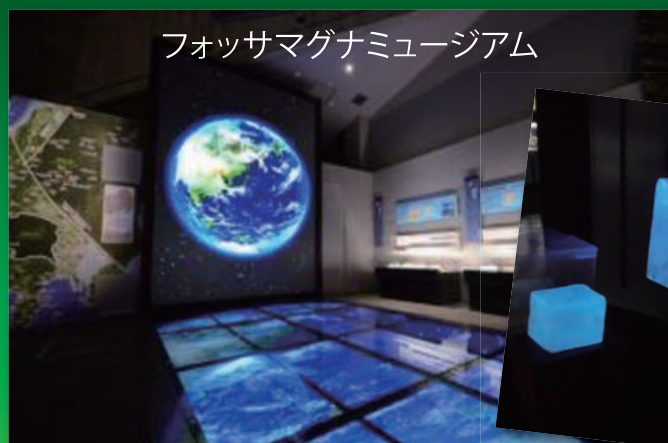
フォッサマグナミュージアム

静岡～糸魚川を中心とした日本列島の真ん中あたりは、実は数百万年前までは大きな海でした。この“フォッサマグナ”といわれる大地の裂け目から、現在の日本列島のかたちになどどのようにしてなったのでしょうか？地球誕生の秘密から日本列島の成り立ちを学習し、縄文時代から始まった世界最古のヒスイ文化の神秘を探り、日本の国石にもなっている“ヒスイ”が採取できる海岸で、ヒスイを含めた様々な岩石を集めて“オリジナル岩石標本”を作成します。